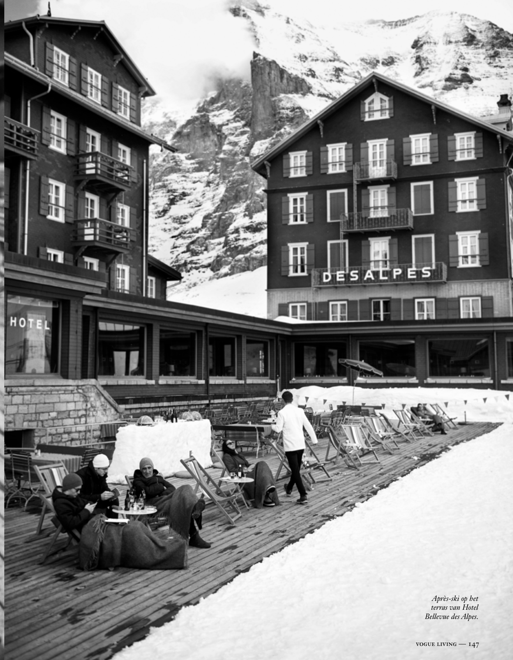
Après-ski op het terras van Hotel Bellevue des Alpes.