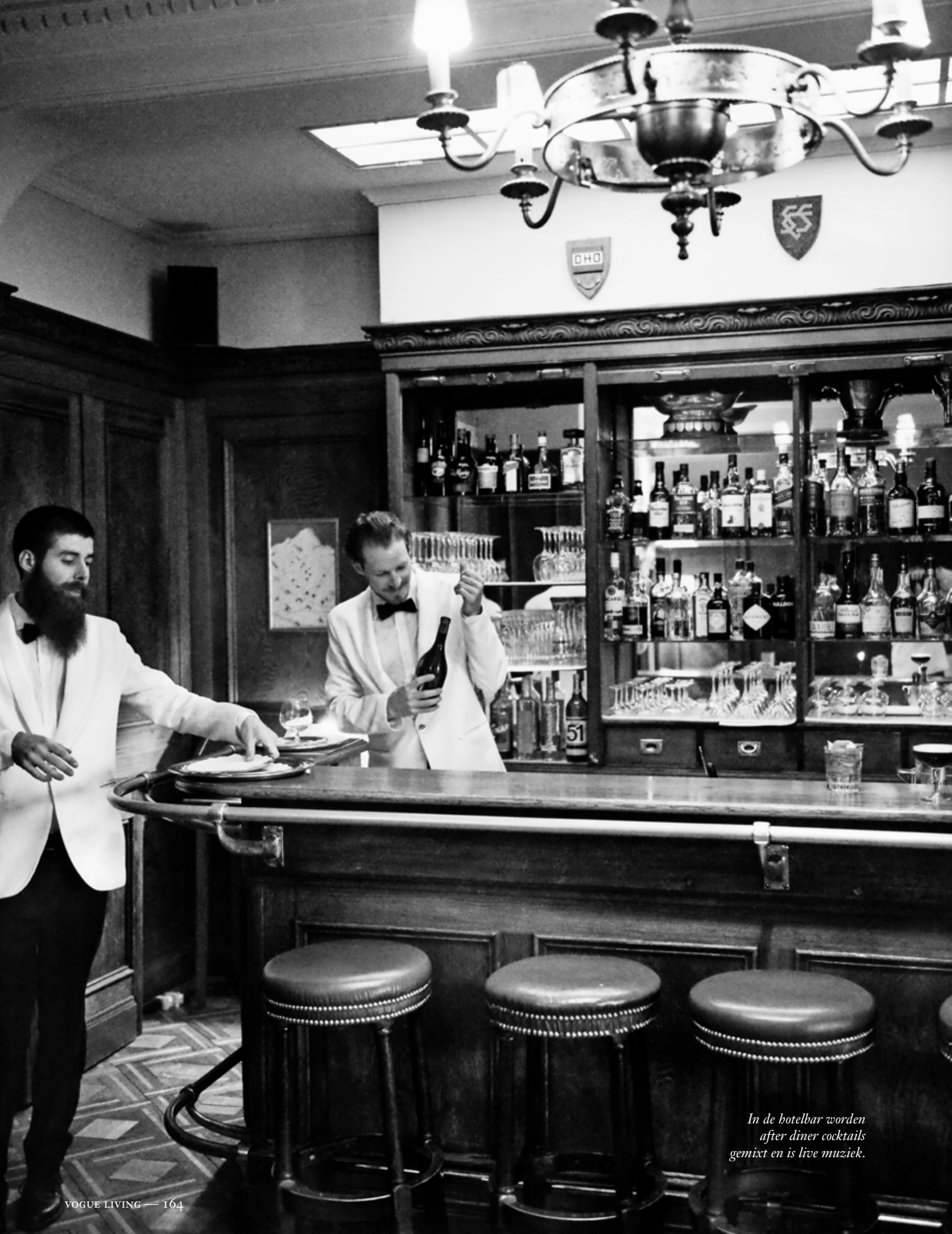
In de hotelbar worden after diner cocktails gemixt en is live muziek.