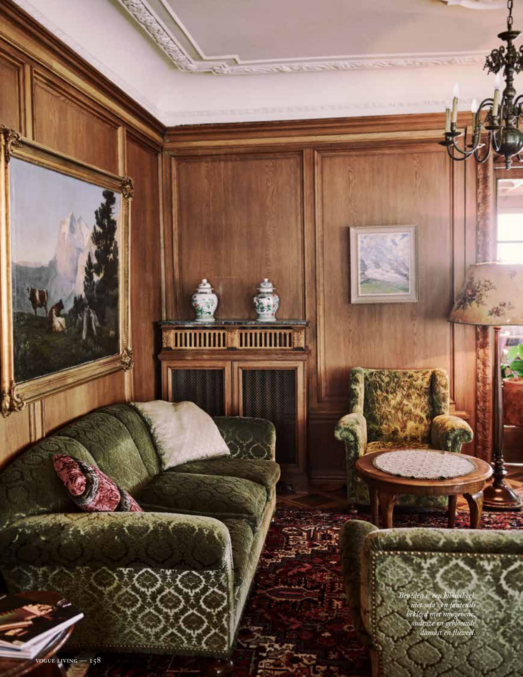
Beneden is een bibliotheek met sofa's en fauteuils bekleed met mosgroene, oudroze en gebloemde damast en fluweel.