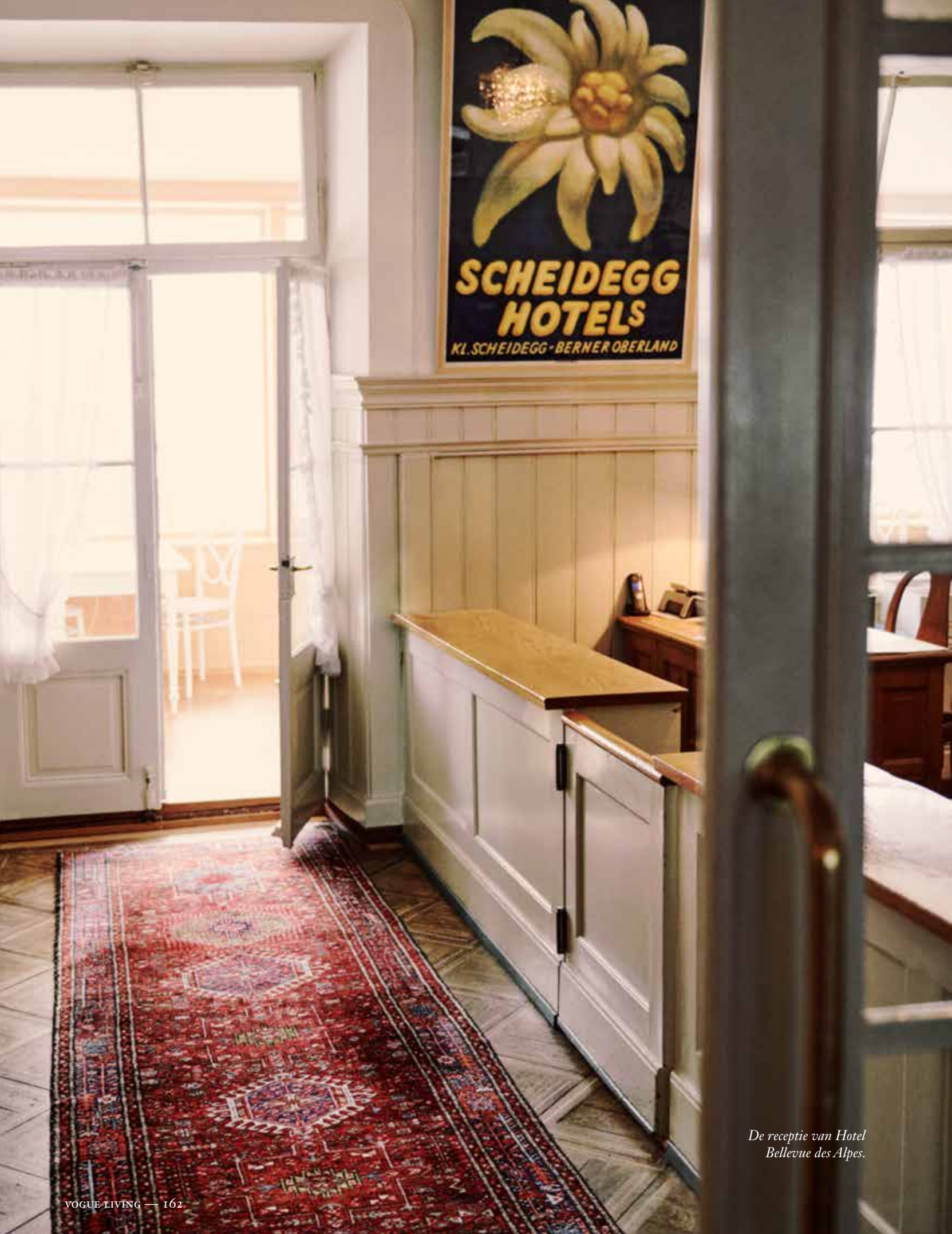
De receptie van Hotel Bellevue des Alpes.